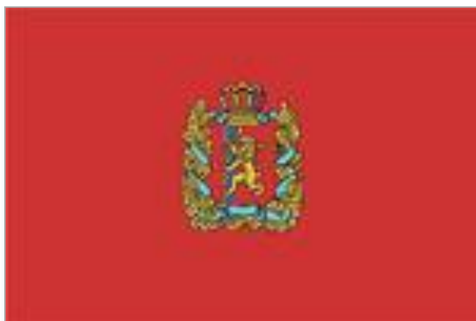
Флаг Красноярского края