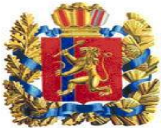
Герб Красноярского края