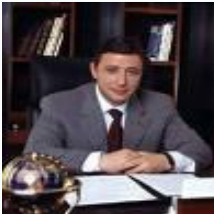
А. Г. Хлопонин, губернатор Красноярского края