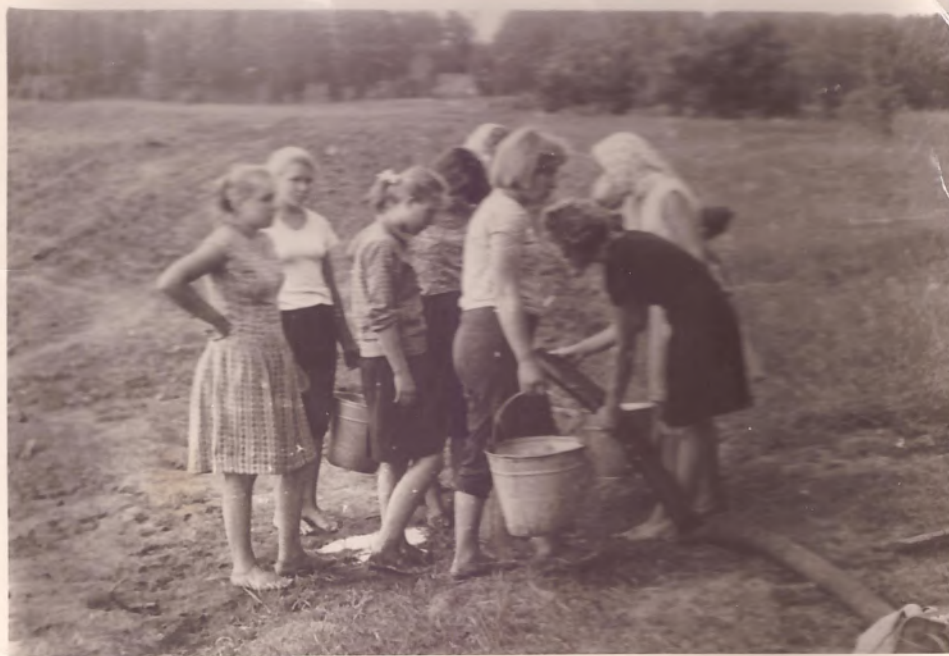
Во время летней практики в саду. 1964 г.