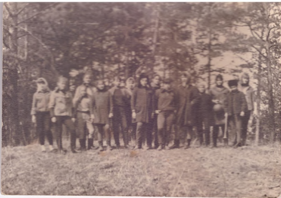
Во время соревнований. 1969 г. (примерно)